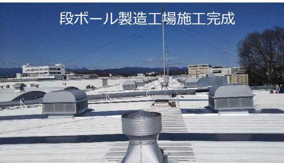
段ボール製造工場施工完成