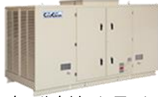
クールクリーンファン CC-470S2-E3 3台

工場100m X 15m RFS-36PR-E3 14台 CC-470S2-E3 3台 工事費込み総額50,000,000円 (税別)