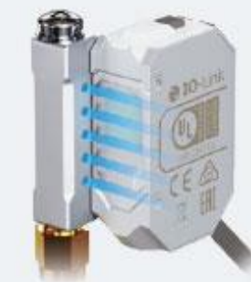
エアブローユニット