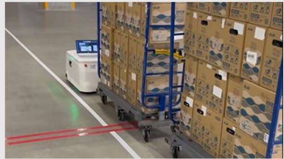
※埼玉県内実機持ち込み搬送テスト無料